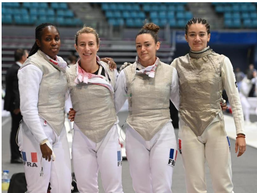
Avec l'équipe de France A senior